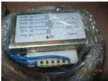
Трансформатор для S99