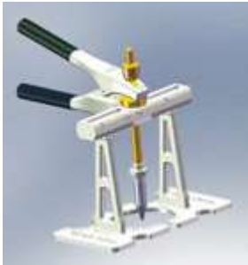
F 063 Гребенка для проволоки с 4 крючками