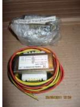
Трансформатор для S50