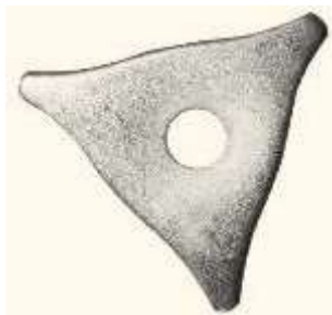
F 015 Треугольники для сварки (100шт.)