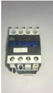
Трансформатор для S99